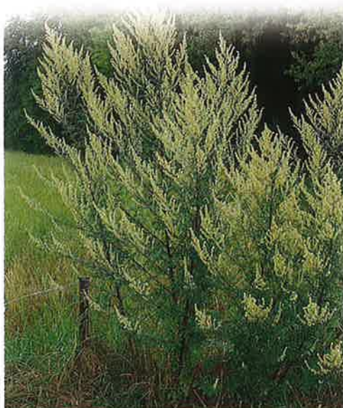
ARMOISE VULGAIRE EN FLEUR

Observatoire des ambroisies, d'après DDAS Rhône