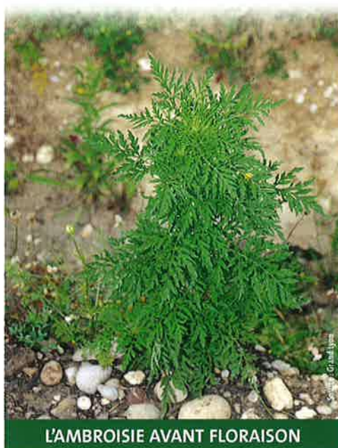
L'AMBROISIE AVANT FLORAISON