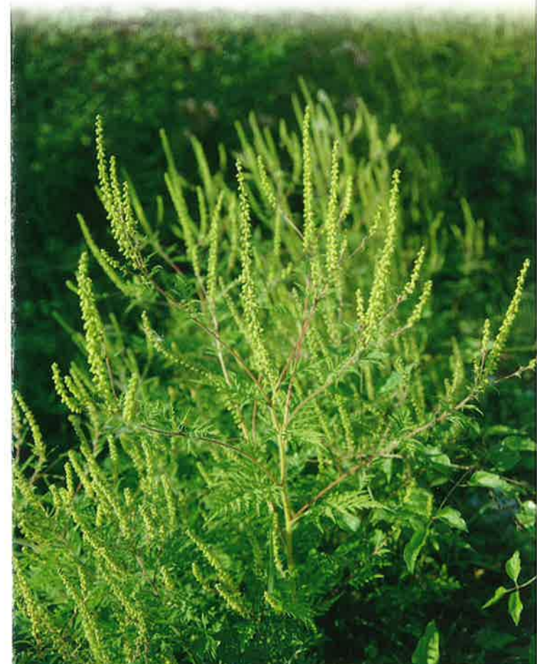
AMBROISIE A FEUILLES D'ARMOISE