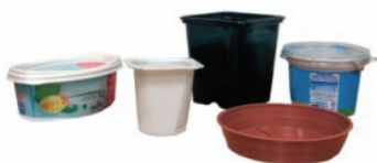
Les pots en plastique type yaourt ou barquette de beurre

Grâce aux efforts de chacun, les tonnages du Tri augmentent mais sa qualité ne doit pas être laissée pour compte. En effet, certaines erreurs persistent souvent par méconnaissance et viennent polluer les bacs involontairement. En voici quelques exemples :