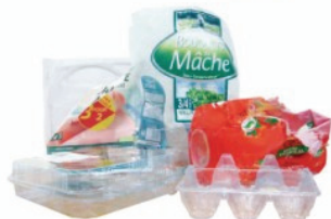
Les barquettes en plastique, les films et les suremballages en plastique