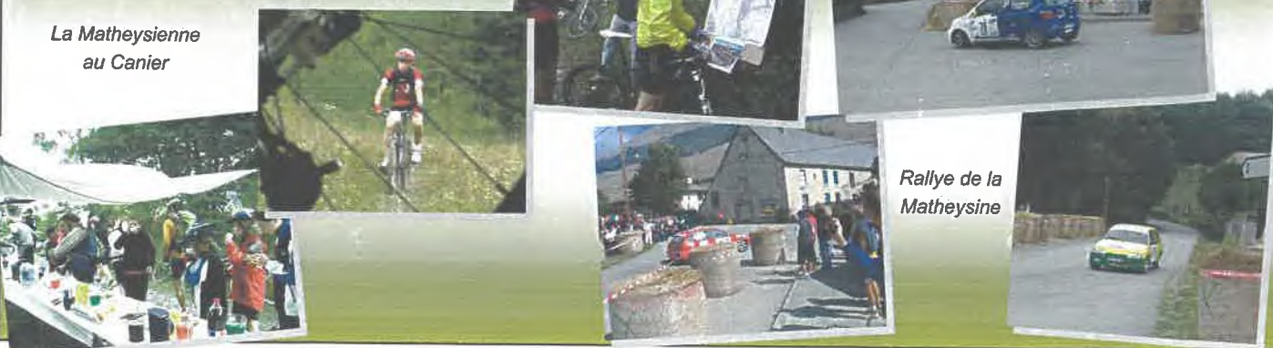
Rallye de la Matheysine

Si vous avez des idées, des photos, des articles, ... ils sont les bienvenus. Vous pouvez nous les déposer en mairie ou via internet à l'adresse suivante