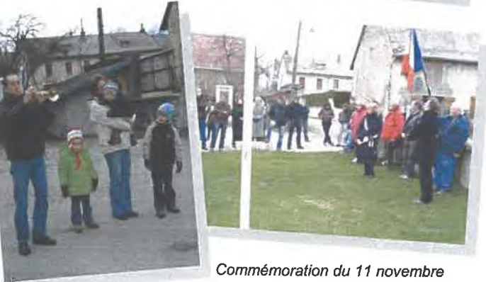
Commémoration du 11 novembre