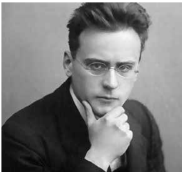
Anton von Webern (1883-1945)

Suite aux désastres des deux conflits mondiaux, conscients que la tradition académique de l'Ancien Monde n'a laissé que dévastation et horreur, ces artistes veulent reconstruire le système musical sur des bases solides et durables. Pierre Boulez (en France), Luigi Nono (en Italie) et Karlheinz Stockhausen (en Allemagne) – pour ne citer qu'eux – se tournent alors vers Anton von Webern, disciple d'Arnold Schoenberg (lire Synergences hebdo n°658 ). Ces deux compositeurs laisseront à la postérité une nouvelle technique de composition fondée sur des règles strictes qui régissent tous les paramètres du son (hauteur des notes, durée, intensité, etc.). Il en résultera dès les années 1950, des œuvres plutôt sévères, abstraites et souvent assez difficiles à appréhender pour un public non averti ( écoute 1 ).