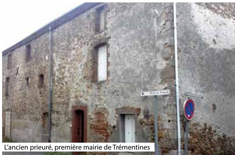
L'ancien prieuré, première mairie de Trémentines