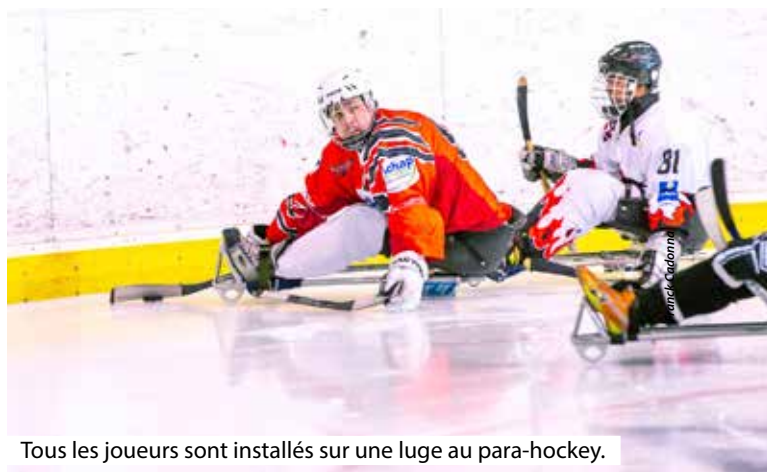
Tous les joueurs sont installés sur une luge au para-hockey.

Le para-hockey est une discipline, encore méconnue, déclinée du hockey sur glace, qui se démocratise de plus en plus. « Sport inclusif, il permet à chacun, homme, femme, valide ou en situation