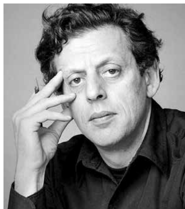
Philip Glass (né en 1937)