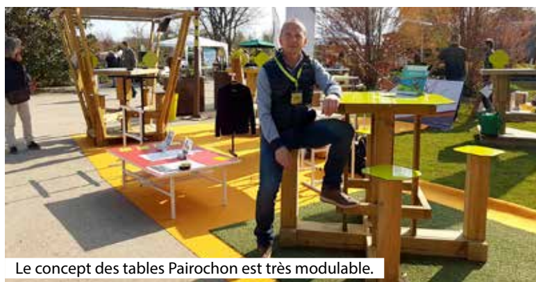
Le concept des tables Pairochon est très modulable.

Parallèlement, il était engagé associativement dans un club de sport. Et c'est dans ce cadre qu'il a eu l'idée qui, aujourd'hui, est la raison d'être de son entreprise. « Un jour, j'ai eu un besoin matériel et j'ai imaginé des mange debout en bois pour désengorger le bar associatif dont je m'occupais , raconte-t-il. Et petit à petit, ce sont devenus des lieux de rassemblement. »