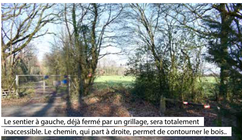
Le sentier à gauche, déjà fermé par un grillage, sera totalement inaccessible. Le chemin, qui part à droite, permet de contourner le bois..

Des panneaux et un grillage invitent déjà les promeneurs à détourner leur chemin depuis longtemps. Mais à compter du lundi 1 er mars, la partie privée des Bois Lavau, aux abords et au-delà du golf du Chêne-Landry, sera totalement fermée au public.