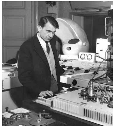
Pierre Schaeffer (1910-1995)

innovations technologiques, nos deux hommes trouvent, notamment avec le magnétophone et d'autres appareils électroniques, le moyen de s'exprimer musicalement avec ces nouveaux outils capables de modifier et d'agencer les sons qu'ils collectent, classent et traitent comme le nouveau matériau sonore du XX e siècle.