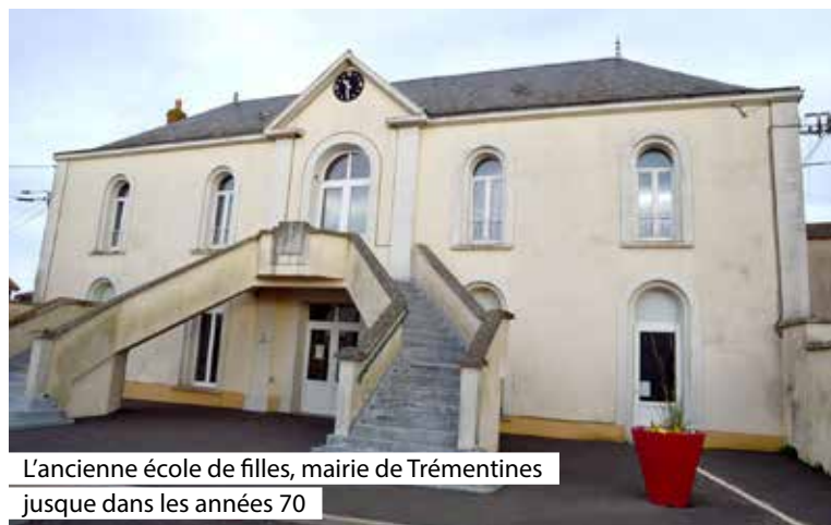
L'ancienne école de filles, mairie de Trémentines jusqu'à dans les années 70