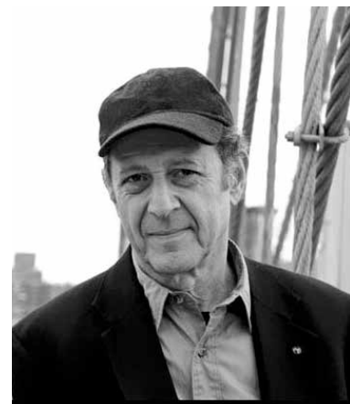
Steve Reich (né en 1936)

Loin de bannir l'héritage du passé, il semblerait que notre musique contemporaine fasse, en quelque sorte, la synthèse de toutes ces richesses stylistiques tout en trouvant de nouveaux terrains d'expression moins conventionnels que les salles de concert. C'est pourquoi il n'est plus exceptionnel de retrouver le nom d'un compositeur actuel sur un programme de concert « classique », puis demain dans un générique de film, et plus tard, à collaborer avec un artiste plus populaire, etc.