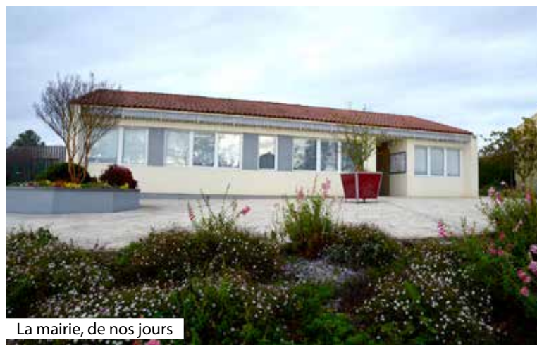
La mairie, de nos jours

À travers cette rubrique, nous retraçons l'histoire de chaque mairie de l'Agglomération du Choletais. Épisode 2/36.