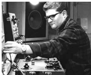
Pierre Henry (1927-2017)

Ils seront ainsi les pionniers de ce qu'on appellera plus tard la « musique électronique » dont un extrait fameux de Pierre Henry est régulièrement utilisé de nos jours dans divers médias ( écoute 3 ).