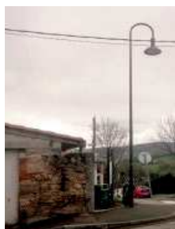
Modèle pour les grands axes du Centre

Bref panorama du programme : les lampadaires de technologie anciennes type "boules" seront changés en priorité, les armoires et les lampes du centre bourg également.