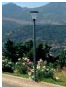
Modèle pour les espaces plus centraux comme le village ou les lotissements