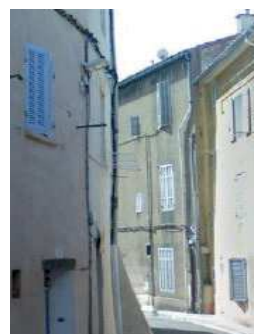
Type projecteur intégré sur façades