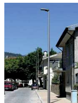
Modèle pour les espaces routiers