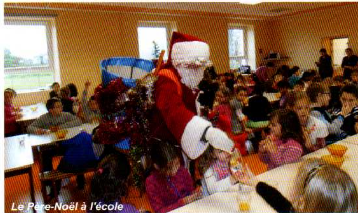
Le Père-Noël à l'école

Les enfants de l'école ont clôturé ce bon moment en chantant la chanson du 'Petit Papa Noël' qu'ils avaient répétée au préalable avec leurs enseignants. Le Père-Noël a été comblé par le bonheur qu'il pouvait lire dans les yeux des enfants.