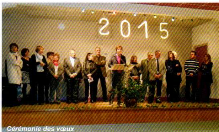
Cérémonie des vœux

Ceux qui n'ont pu se déplacer à l'occasion de ce repas n'ont pas été oubliés pour autant, puisque l'équipe municipale leur a distribué un colis festif. Les personnes hospitalisées ont également reçu leurs colis.