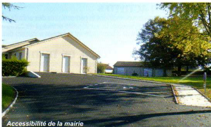
Accessibilité de la mairie

Une contribution financière ayant été accordée par Total Marketing dans le cadre des certificats d'économie d'énergie pour un montant de 2 820 €.