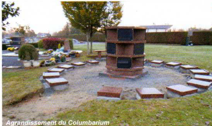
Agrandissement du Columbarium