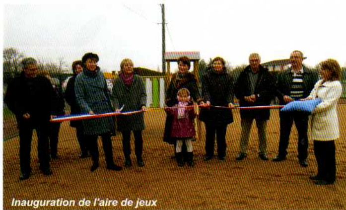
Inauguration de l'aire de jeux