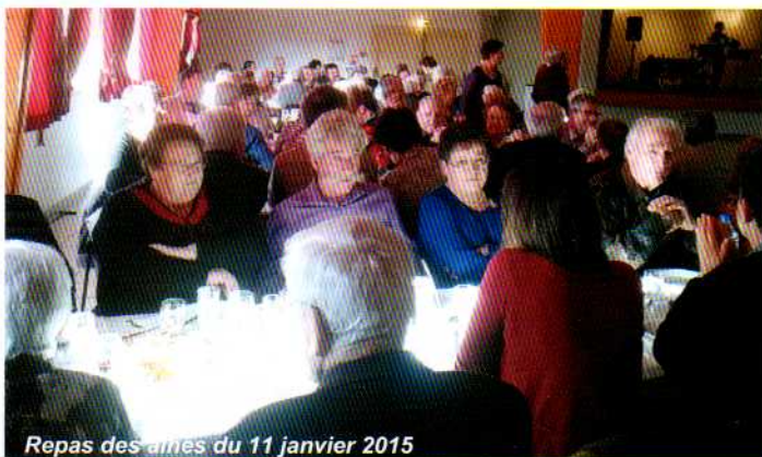
Repas des aînés du 11 janvier 2015