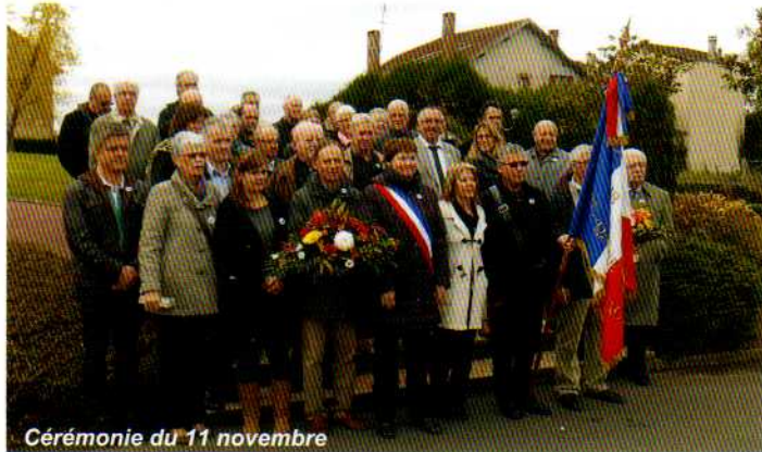
Cérémonie du 11 novembre

A l'occasion des cérémonies commémoratives des 8 mai, 18 juin et 11 novembre, nous nous sommes réunis devant le Monument aux Morts, sur la tombe du soldat inconnu ainsi que devant la stèle du Vincou afin de rendre hommage aux victimes de ces événements.