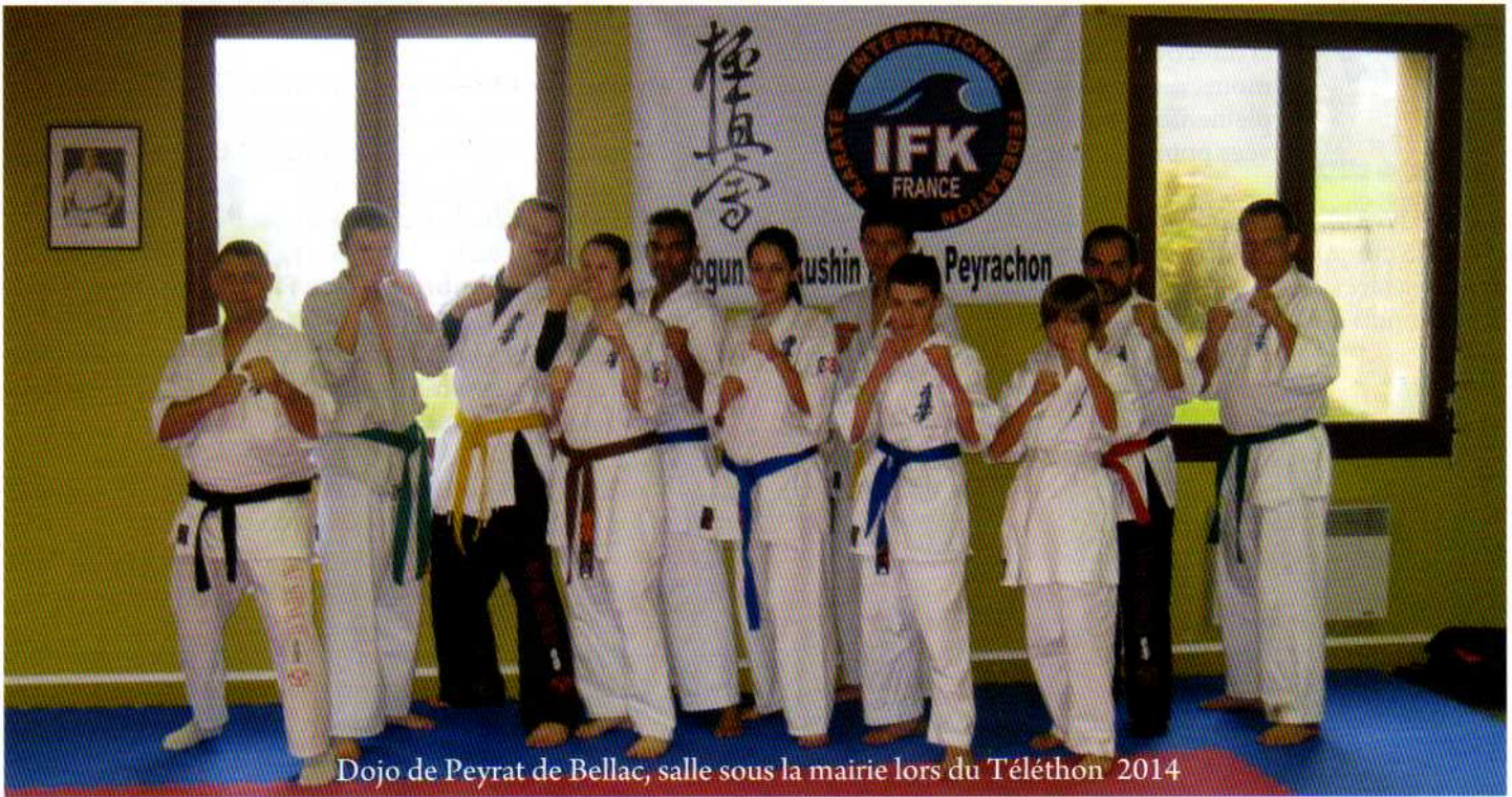
Dojo de Peyrat de Bellac, salle sous la mairie lors du Téléthon 2014