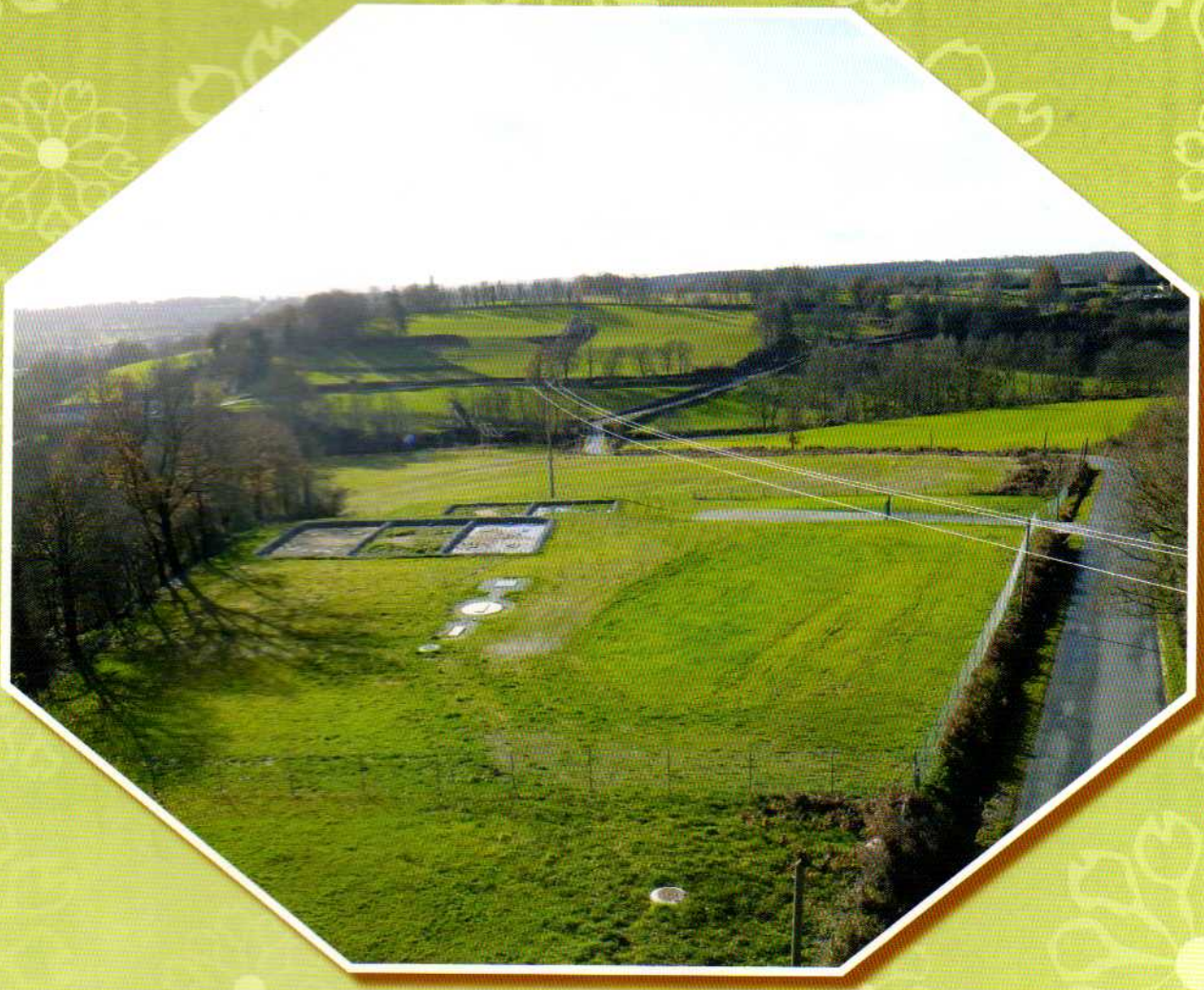
Vue de la nouvelle station de traitement-Route de Sissac