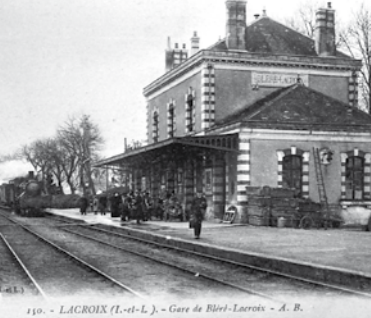
110. - L'ACROIX (1.-et-L.). - Gare de Bléré-La Croix - A. B.