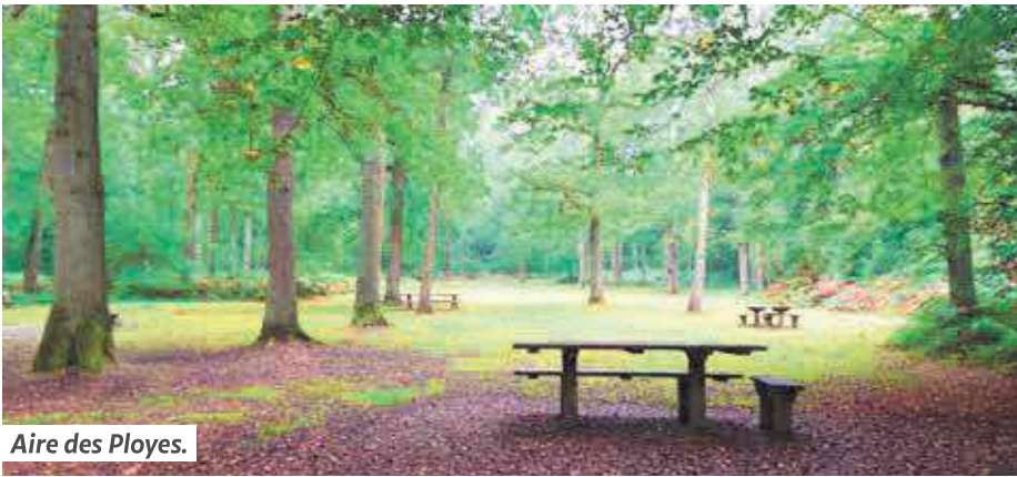
Aire des Ployes.

En forêt de Hez, la chasse en battue est pratiquée tous les vendredis du 15 octobre à fin février. Un calendrier est disponible sur le site de l'ONF.