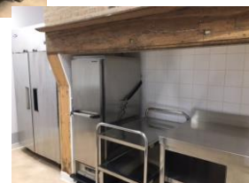
Cuisine du Presbytère après rénovation