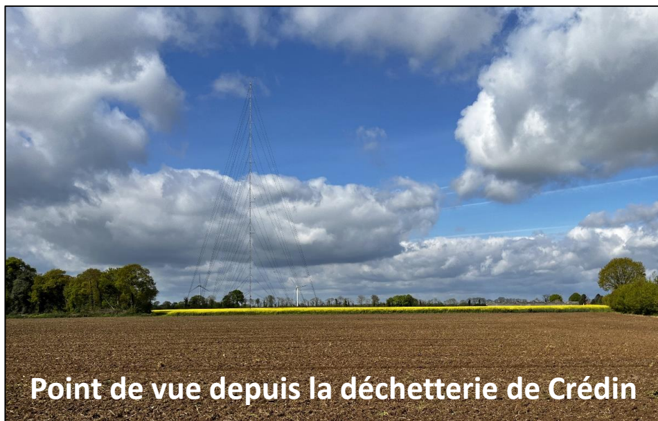
Point de vue depuis la déchetterie de Crédin