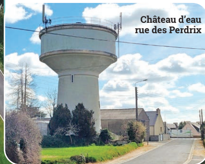
Station de Goasmoal

Consommation pour l'entretien global 4 383 m 3 (lavage réservoirs...)