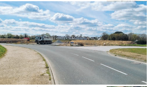
Rond-point de Créac'h-Iller

FIN DES TRAVAUX prévue pour FIN JUIN 2021