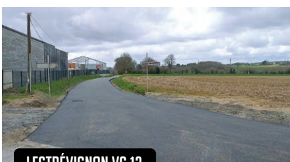
LESTRÉVIGNON VC 12