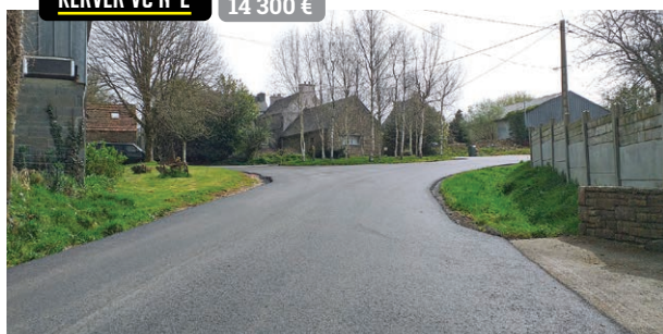
KERVER VC N°2