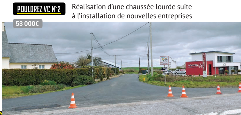
POULDREZ VC N°2

Réfection de chaussée au niveau du hameau