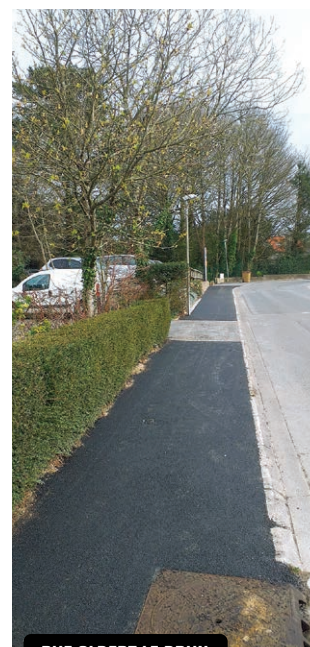
RUE ALBERT LE BRUN

Réfection définitive de chaussée suite à la pose d'un nouveau réseau de transport des eaux usées pour la zone du Vern par le syndicat d'assainissement (S.I.A.L.L.)