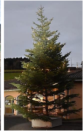
Sapin offert par la société Patay Paysage

A l'école, un vidéo projecteur interactif est venu compléter les outils pédagogiques déjà en place. La troisième classe en sera équipée sur 2021. Une balustrade a été installée sur le mur en dessous de l'école et des portes manteaux ont été réalisés pour la garderie.