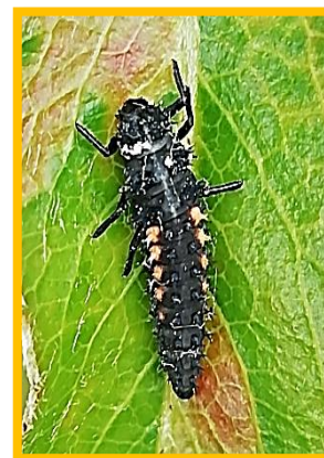
Larve de coccinelle