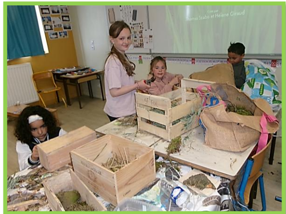
Construction d'hôtels à insectes