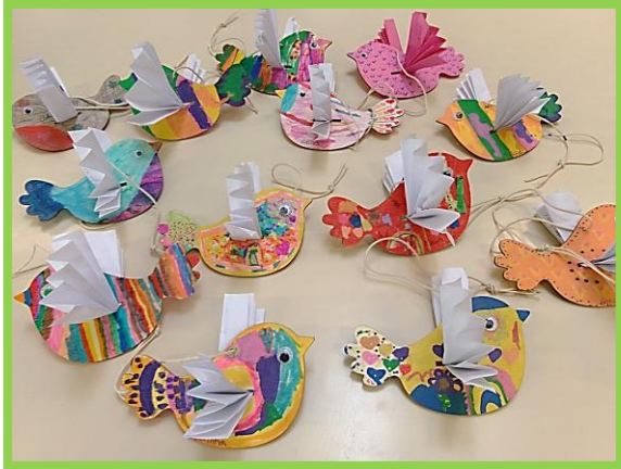
Atelier « Printemps des poètes »

→ Le programme des mercredis périscolaires du mois de mai a été intense avec une diversité d'ateliers.