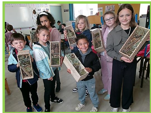
Réalisation d'hôtels à insectes