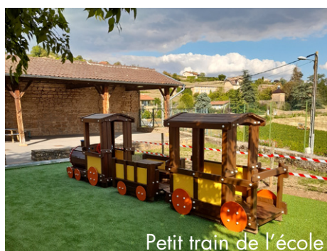
Petit train de l'école