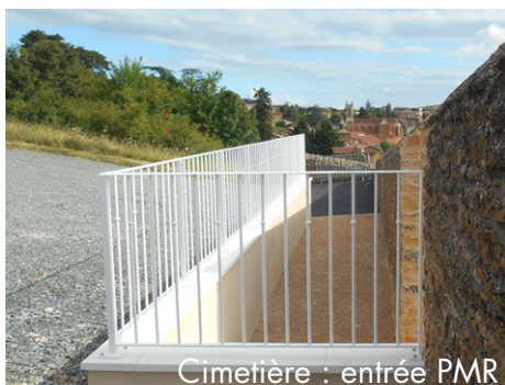
Cimetière : entrée PMR