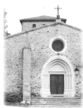
Sts Pierre et Paul