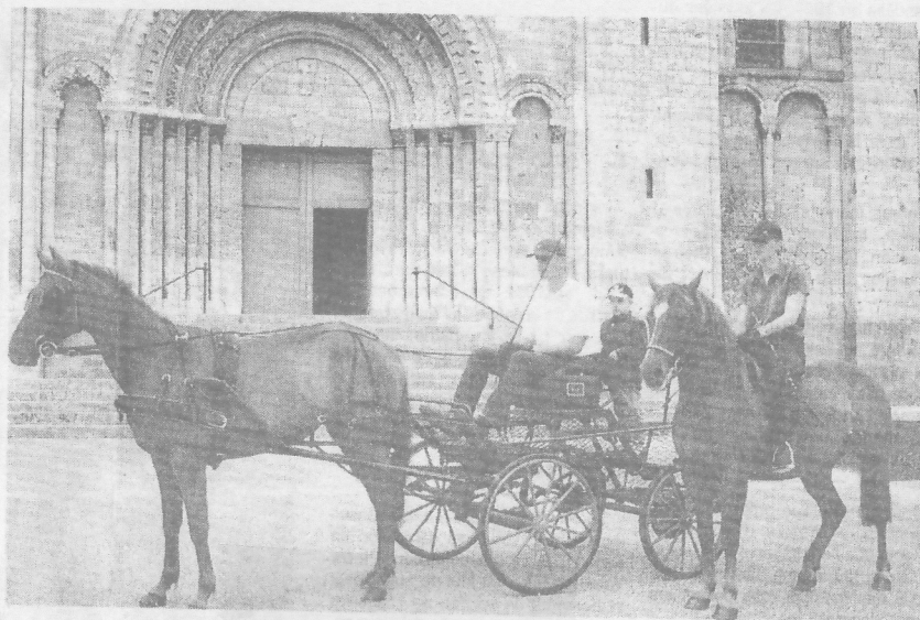
L'attelage, un excellent moyen pour découvrir la nature