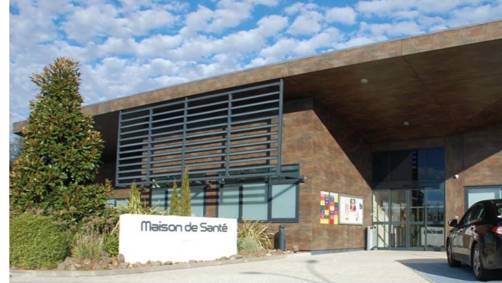
746 m 2 , 10 cabinets et 2 studios pour les internes et les gardes à Hagetmau.

www.chalosssetursan.fr (rubrique culture / médiathèques)