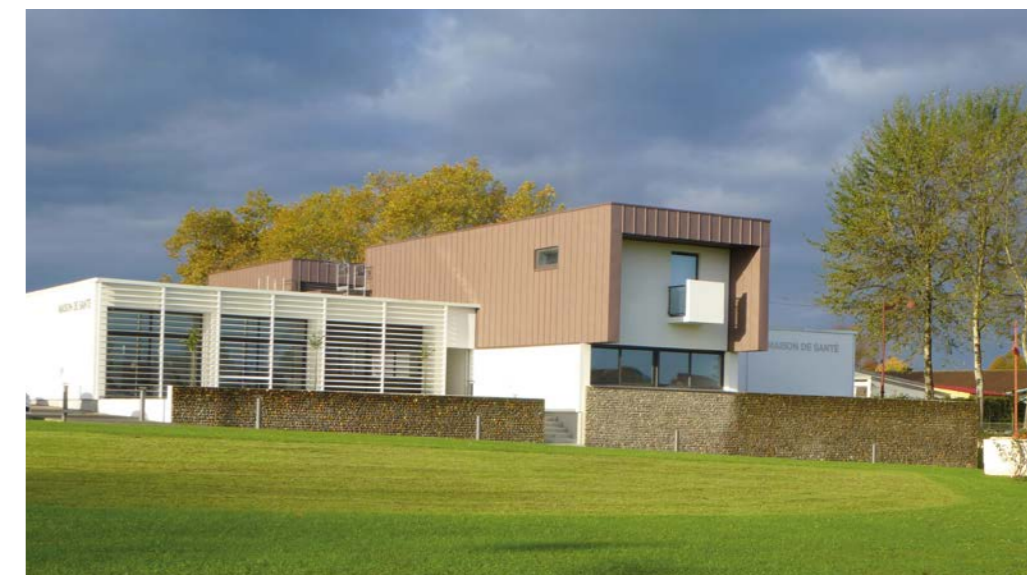
765 m 2 , 11 cabinets et 1 studio pour les internes et les gardes à Samadet.

Dans la France du papy-boom, la densité de médecins généralistes continue de décroître. Selon les projections de l'ordre des médecins, il faudra attendre 2025 pour voir la tendance s'inverser. Dès 2005, nos collectivités ont anticipé cette situation en menant une réflexion à l'échelle du pays Adour Chalosse Tursan, en concertation avec l'union régionale des médecins libéraux. Ce tandem entre collectivités locales et praticiens s'est concrétisé