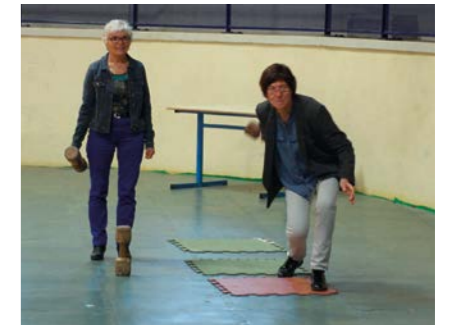
Ci-dessus : une partie de quilles de 6 à Horsarrieu proposée par les Aînés ruraux du village, membres de Générations Mouvement.