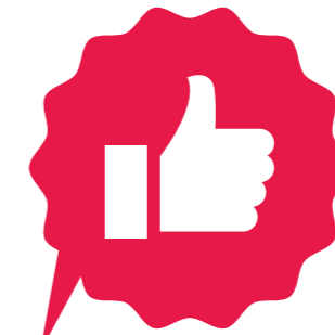
Le public des médiathèques

Si vous étiez un film, vous seriez Comme des bêtes