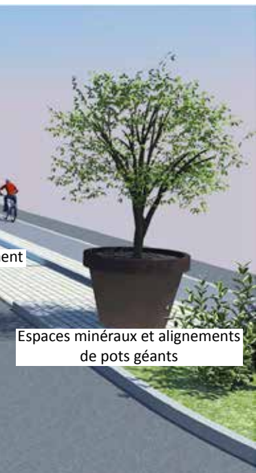
Espaces minéraux et alignements de pots géants