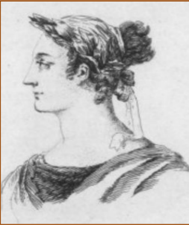
Mlle Du Parc, gravure 1857

Le 17 novembre 1667, Racine présente sa nouvelle tragédie Andromaque dans l'appartement de la Reine, au Louvre. Le rôle-titre en est tenu par Marquise Du Parc (*), une actrice confirmée, née en 1633, qui vient de travailler pendant treize ans dans la troupe de Molière au Palais-Royal. Fille d'un bonimenteur de Lyon, elle a épousé à vingt ans le comédien Du Parc, dit « Gros-René » et suit cette troupe dans ses déplacements divers.