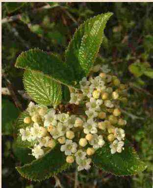
Fleurs de viorne lantane, lantane, viorne mancienne ou viorne flexible ( Viburnum lantana )