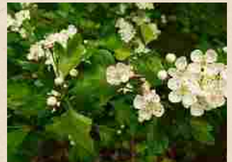
Aubépine à un style ( Crataegus monogyna )