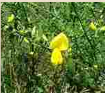
Fleurs de genêt à balais ( Cytisus scoparius )