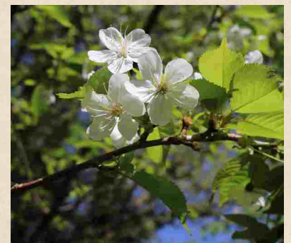
Fleurs de merisier, ou cerisier des oiseaux ( Prunus avium )