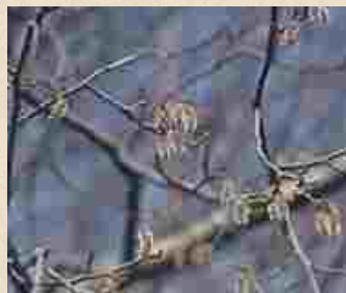
Chatons de peuplier blanc ou peuplier de Hollande ( Populus alba )