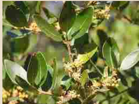
Fleurs de filaire à feuilles larges ( Phillyrea angustifolia )