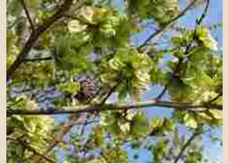
Samares d'orme champêtre, ormeau, petit orme ou ipréau ( Ulmus minor )