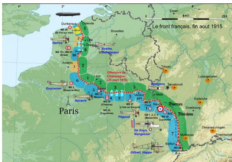
Le front français, fin août 1915

25 septembre 1915 : Lancement d'une nouvelle vague d'offensives franco-britanniques sur le front ouest, en Champagne et en Artois . L'attaque en Artois est destinée à faire diversion pour faciliter la seconde bataille de Champagne, dont l'objectif est de rompre définitivement le front adverse. Malgré quelques succès locaux, les pertes humaines sont importantes et les munitions s'épuisent, si bien que les combats sont arrêtés le 11 octobre.